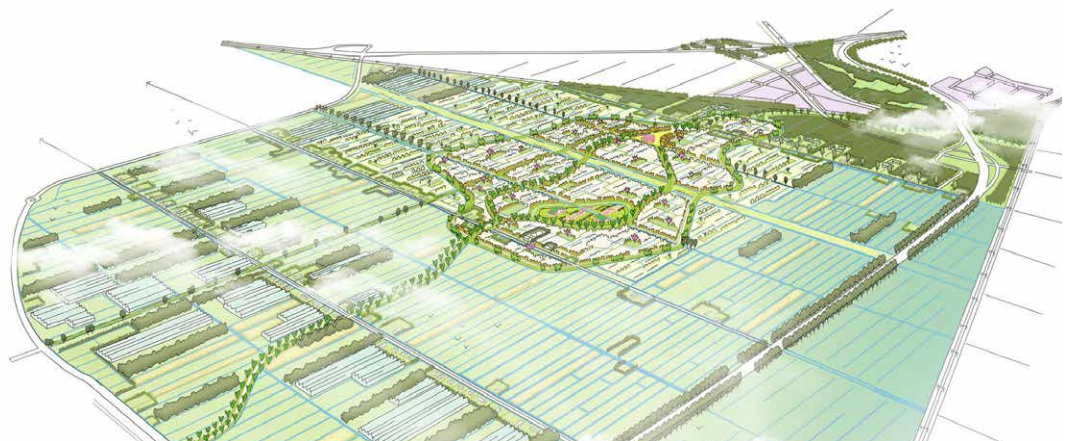
Masterplan Middengebied Zuidplaspolder in vogelvucht